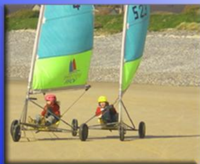
Char à Voile monoplace - conduite aux pieds -