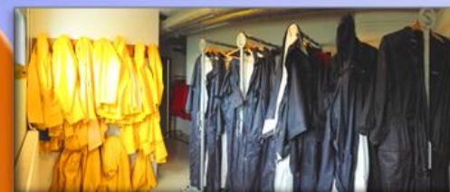
Cirés/Combinaisons à disposition