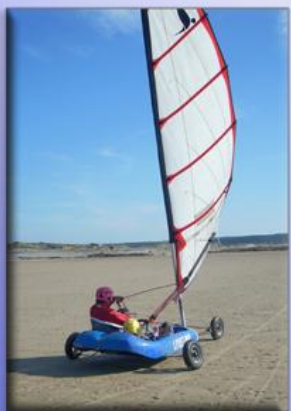
Char à Voile Biplace - conduite volant -