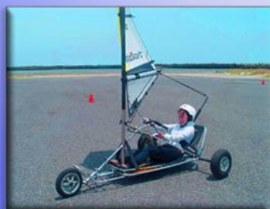
Blokart - conduite guidon -