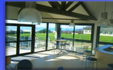
Club House panoramique avec vue sur la mer