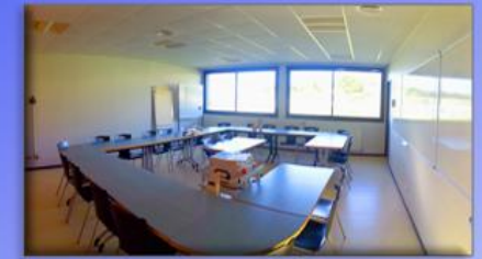
2 salles de réunion équipées (25 places assises)